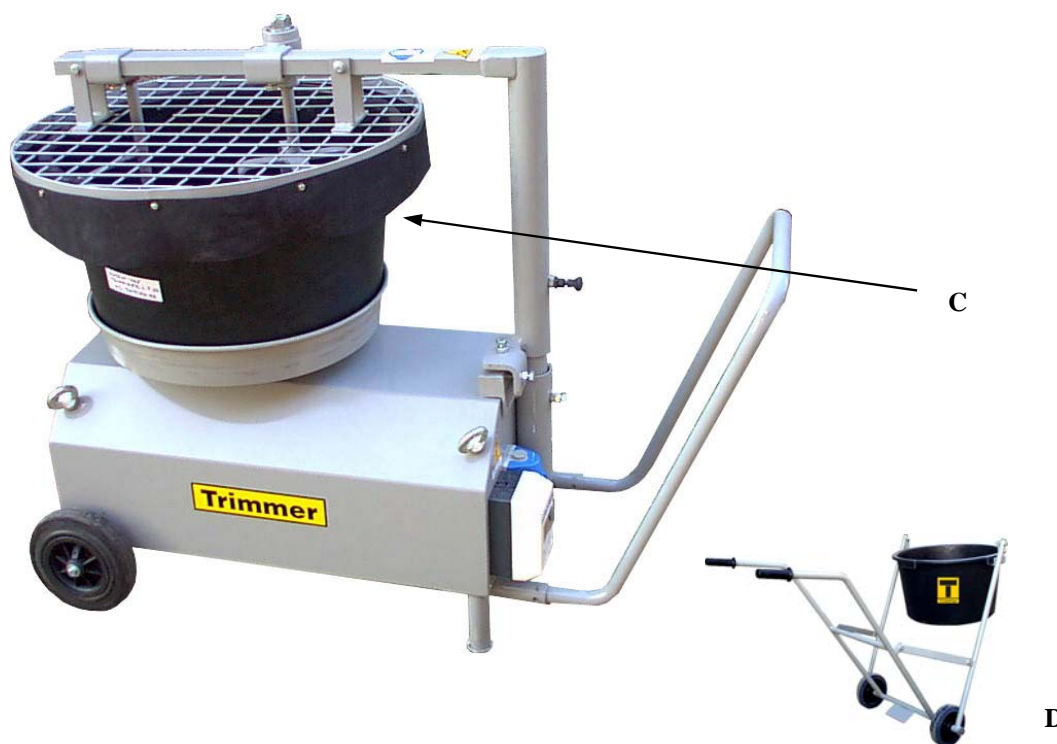
CARRELLO PER TRASPORTO CONTENITORE