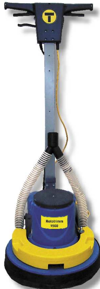
Dischi diamantati HTC Twister™